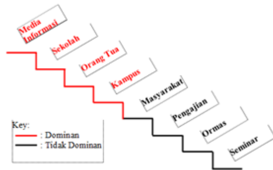
Gambar 2. Rangkaian Internalisasi Perilaku Konsumsi yang Berwawasan Lingkungan

Proses internalisasi nilai-nilai konsumsi ke dalam perilaku konsumsi yang berwawasan lingkungan mahasiswa Fakultas Ekonomi jurusan Pendidikan Ekonomi Universitas Negeri Malang diproyeksikan berdasarkan ungkapan informan bahwa kampus, sekolah, orang tua, pengajian, masyarakat, ormas, media informasi dijadikan sumber informan untuk pedoman dalam melakukan kegiatan konsumsi. Yang paling dominan adalah media informasi berupa penyiaran televisi ataupun berita yang dimuat di koran atau internet , karena zaman yang sudah maju dan akses untuk informasi menjadi sangat mudah. Oleh karena itu, faktor tersebut menjadi faktor yang sangat dominan dalam