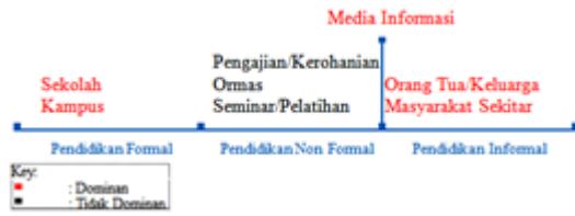
Gambar 3. Jalur Proses Internalisasi Perilaku Konsumsi yang Berwawasan Lingkungan dalam Pendidikan

Selanjutnya proses internalisasi juga melalui tiga jalur, yakni pendidikan formal, nonformal, dan informal, serta mediasi informasi sebagaimana pada Gambar 3.