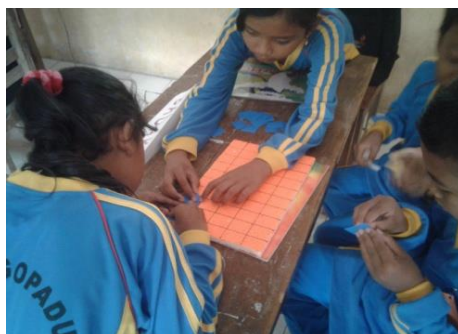
Gambar 2. Aktivitas diskusi kelompok dengan menggunakan papan berpetak

Bagi anggota kelompok yang telah menyelesaikan LKS nya, diberikan kesempatan untuk menyajikannya di depan kelas. Aktivitas siswa dalam presentasi di depan kelas diamati oleh guru dengan menggunakan rubrik asesmen kinerja. Setelah setiap kelompok menyelesaikan presentasi, aktivitas berikutnya yaitu refleksi bersama guru dan siswa terkait materi pembelajaran yang telah dipelajari bersama. Refleksi juga dilaksanakan untuk membimbing siswa dalam menyimak kembali setiap jawaban yang diuraikan dalam LKS. Guru memberikan pertanyaan agar siswa mengungkapkan pendapatnya.