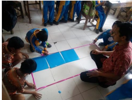
Gambar 1. Guru menyajikan ubin pada lantai yang telah diberi kertas warna

Aktivitas pengamatan lain yang dilaksanakan yaitu terkait dengan ubin pada lantai kelas. Guru mempersiapkan 10 ubin pada lantai kelas untuk diamati oleh siswa.