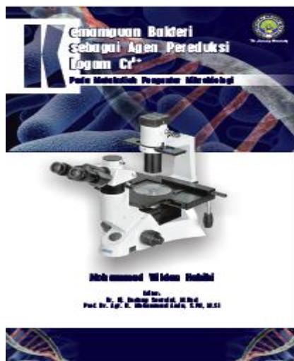
Gambar 2. Tampilan Cover Depan

Cover depan berisi judul buku: Kemampuan Bakteri sebagai Agen Pereduksi Logam Cr 6+ , selain itu juga terdapat identitas penulis, editor, dan institusi asal (Gambar 2).