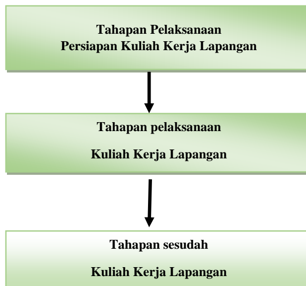
Gambar 1. Diagram Alir Kuliah Kerja Lapangan

Implementasi Kuliah Kerja Lapangan didefinisikan sebagai suatu proses penerapan ide, konsep, dan kebijakan dalam suatu aktivitas pembelajaran, sehingga peserta didik menguasai seperangkat kompetensi tertentu sebagai hasil interaksi dengan lingkungan. Implementasi dari kuliah kerja lapangan di Universitas Negeri Malang terdiri atas tiga tahap, yakni tahapan persiapan, pelaksanaan, dan sesudah kuliah kerja lapangan. Berikut ini gambar diagram alir Kuliah Kerja Lapangan.