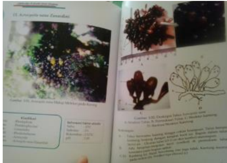
Gambar 2. Buku yang memuat deskripsi dan data hasil penelitian keanekaragaman Rhodophyta

Gambar 1 menunjukkan bahan ajar berupa foto dan gambar. Bahan ajar ini dapat digunakan untuk mempelajari karakteristik rhodophyta. Gambar 2 menunjukkan bahan ajar berupa buku. Buku memuat lebih banyak informasi daripada bahan ajar berupa foto maupun gambar karena didalamnya buku selain memuat foto dan gambar juga memuat informasi peranan dan metode penelitian. Bahan ajar berbasis cetak lebih berfokus pada konten visual. Konten visual menurut Katsioloudis (2010) dapat memfasilitasi peserta didik dalam peningkatan perolehan informasi, terutama jika detail visual ditambahkan.